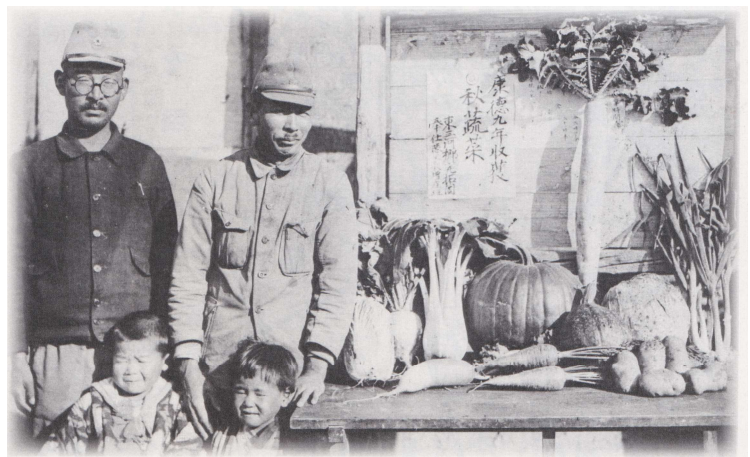
東三河郷開拓団の紹介写真 1942年撮影